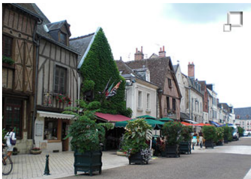
Precioso casco histórico de Amboise

La entrada al pueblo se realiza por la parte alta, puesto que éste se encuentra justamente entre la zona baja a la altura del Loira, y la parte alta del antiguo cauce, justo rodeando el castillo que se encuentra incrustado en las rocas que hacen de ladera del cauce. Nos detenemos junto al museo - casa de Leonardo Da Vinci , donde de nuevo tenemos unos tres cuartos de hora para realizar una rápida visita a la ciudad, bien al casco histórico y exterior del castillo, o bien a la casa-museo de Leonardo. La acertada recomendación del guía es la visita al casco histórico, precioso con sus restauradas casas medievales y renacentistas, muy agradable, animado, lleno de terrazas y comercios y con unas buenas vistas a las murallas del castillo. El casco histórico se encuentra rodeando las murallas del castillo, y éste se encuentra "empotrado" en las paredes rocosas que formaría la erosión del río Loira.