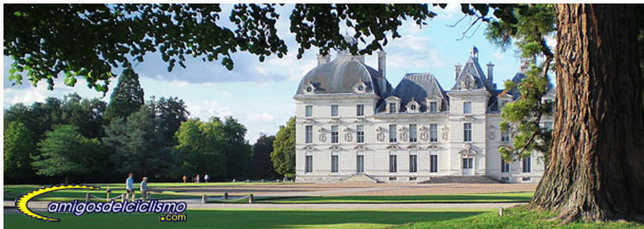
Castillo de Cheverny y sus jardines

Después de la visita, que supone una buena excursión para estirar las piernas, de vuelta al hotel, cena y a descansar que "ya toca".