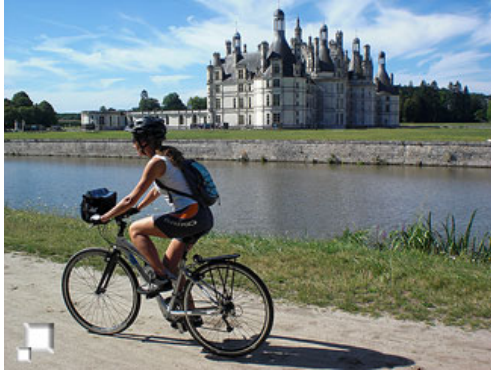
Se rodea el castillo de Chambord

Después de un pequeño descanso, el grupo regresa al hotel en St Dyé donde se deja el resto de la tarde libre. Las opciones para ocupar el tiempo son varias: alargar la ruta siguiendo el carril bici que bordea el río Loira o alguna de las rutas balizadas, visitar alguno de los cercanos pueblos (aunque con poco ambiente realmente), bañarse en el río, o simplemente descansar en los jardines del hotel.