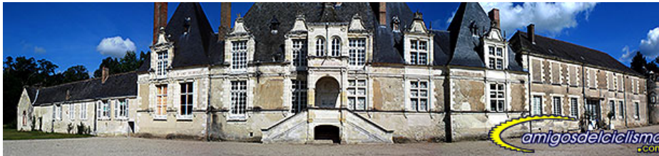
Chateau de Villesavin

en algunas zonas por estanques. Los estanques que encontramos en general son pequeños, pero el de Le Grand Cottereau tiene unas considerables dimensiones y bordea un tramo del camino. Este tramo de la ruta es todo un deleite para la vista y sin absolutamente nada de tráfico.