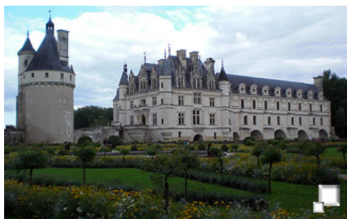
Chateau de Chenonceaux

tiendas y talleres, con lo que cualquier problema que tuvieras en una ruta "a tu aire", podrías solucionarlo.