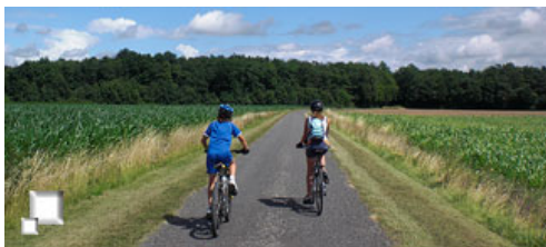
Cultivos y bosques se suceden

Una vez remontado el cauce, siguiendo carreteras de escaso tráfico, nos dirigimos hacia Feings por tierras de cultivos alternadas con bosques, y empiezan a ser habituales los estanques en un número bastante elevado. En Feings comemos el ya tradicional picnic en la entrada de una mansión no visitable ( chateau de Boissay ) y nos acercamos al pueblo de Fougères , situado a escasos kilómetros. Aquí disponemos de un poco de tiempo, que algunos aprovechan para visitar el castillo de esta ciudad (el cual no