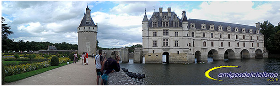
castillo de Chenonceaux

Comida-picnic en el jardín del hotel, de nuevo con mucho encanto: casona antigua perfectamente conservada, tanto exterior como interiormente, jardín con estanque y unos centenarios árboles de tamaños descomunales (algún Tejo que podría ser milenario) hacen del lugar un sitio encantador. Merecida siesta " española " y ahora sí, visita con toda tranquilidad al castillo de Chenonceaux, situado a escasos mil metros del hotel.