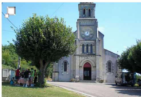
Picnic en la iglesia de Candé

comilona para recoger trastos y dirigirnos al hotel, que se encuentra muy cercano a este lugar.