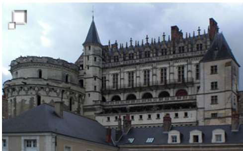
Chateau de Amboise

Si con todas estas explicaciones no tienes suficiente o te surge alguna otra duda, puedes ponerte en contacto con BikeSpain ( www.bikespain.info ) para preguntarles cualquier duda que tengas y te contestará con rapidez.