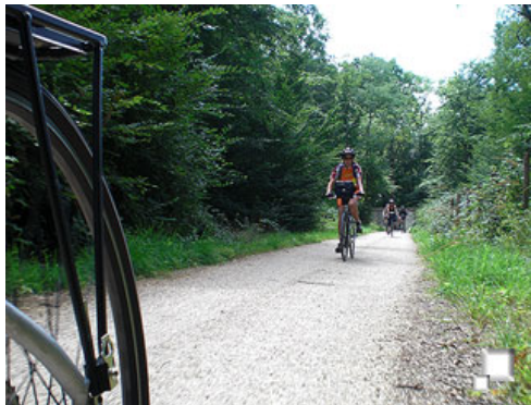
De nuevo en dominios de Chambord

Después de la visita, nos dirigimos ya por carretera con algo de tráfico, a la ciudad de Bracieux tras unos 14 km desde la salida, donde tomamos un tentempié y nos reagrupamos. A partir de aquí, de nuevo abandonamos la carretera para el resto de la ruta, ya que discurrirémos por los preciosos carriles bici que hay en los bosques que rodean el palacio de Chambord . Estos carriles bici que circulan por dentro de frondosísimos bosques, es de lo mejor que se puede disfrutar por esta zona, sin contar con la vista que de nuevo tendremos del "chateau" cuando crucemos alguna de las carreteras o pistas que desembocan en el castillo.