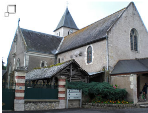
Todos los pueblos con su iglesia

Hacia Amboise circulamos por carreteras poco transitadas en su mayor parte, que discurren en alternancia entre campos cultivados y espesos bosques en los que los árboles a duras penas dejan penetrar la luz solar. Además pedaleamos entre numerosos estanques que quedan ocultos a los menos atentos al estar siempre detrás de frondosos setos. De momento la lluvia nos respeta y la temperatura, con el cielo encapotado, es perfecta para pedalear. Pasamos por numerosos pueblos, todos encantadores, en los que vamos reagrupándonos: Vallières les Grandes, Souvigny de Touraine, Saint Relgé y por fin el ansiado Amboise.