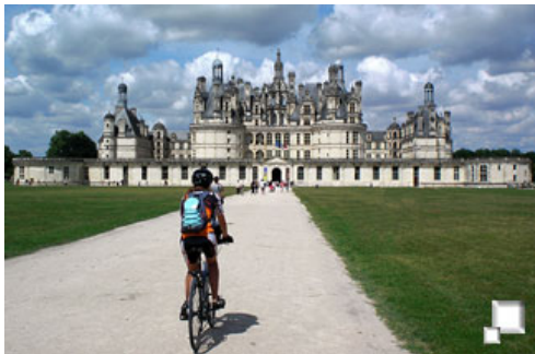
Chateau de Chambord

Mira la pregunta anterior. Tan sólo debes saber montar en bici y poder aguantar pedaleando, a ritmo tranquilo o muy tranquilo, varias horas. No hay puertos ni terrenos difíciles.