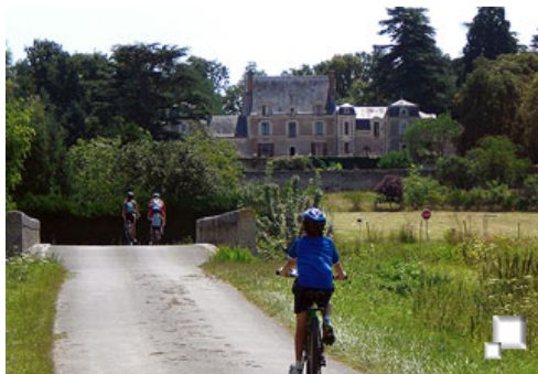
Caserón camino de Candé