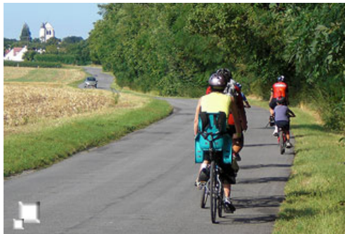
Viaja en bici por Europa