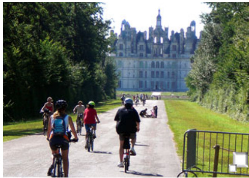
La aproximación al castillo es espectacular

Una vez visitado el castillo, el grupo se reúne de nuevo para dirigirse a una zona apartada a comer. El picnic que nos han preparado es estupendo: ensaladas, embutidos y quesos de la tierra, gazpacho (sí, sí, el andaluz) y otros víveres reponen las fuerzas de los ciclistas, que aún sin muchos kilómetros en las piernas sí llevan muchas horas pedaleando.