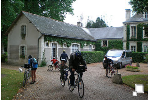
Abandonamos el hotel de Civray

Día 4: Civray de Touraine - Montrichard - Bourre - Fougères - Cheverny