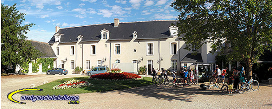
Salida de la primera ruta desde la Maison Bel Air

Día 1: St Dyé sur Loira - Chambord - St Dyé sur Loira