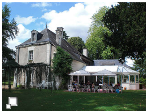
Todos los hoteles tienen mucho encanto

Lo que veréis en este reportaje es una crónica del viaje que hemos realizado, pero antes de entrar a detallar el viaje en sí, queremos detenernos a hablar un poco de la empresa BikeSpain , que ha tenido la amabilidad de invitarnos a acompañarles en la edición de agosto de 2008 y conocer cómo trabajan "sobre el terreno".