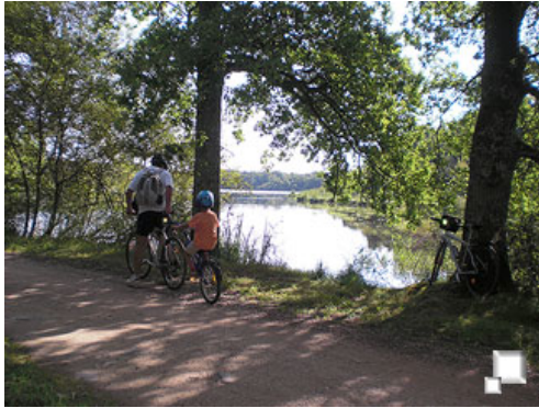
Estanque Le Grand Cottereau

Amigosdelciclismo.com > Rutas > Castillos del Loira > Día 5