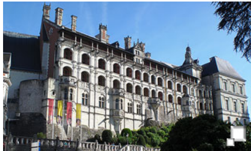
Chateau de Blois

La oferta de viajes de BikeSpain es muy amplia, así que deberás ver, en el viaje que elijas, la longitud de las rutas. Todas, o la gran mayoría, son sencillas en cuanto a desnivel acumulado, que es muy escaso, y discurren por lugares sin dificultad ninguna, así que sólo debes de estar preparado para pasar unas cuantas horas encima de la bici y disfrutar del paisaje. En este viaje en cuestión, hicieron todas las etapas, como extremos, un niño de 7 años y una mujer de más de 65 sin problemas.