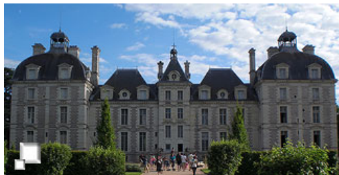
Chateau de Cheverny

Por otra parte, has de valorar si el hecho de llevarla te va a crear muchos problemas, según en el medio de transporte que vayas. Y si es una bici muy cara, quizá en ciertos momentos no estés del todo relajado pensando en si te la roban. Realmente las bicis nunca se quedan solas, porque al visitar los castillos siempre se queda alguien vigilándolas y en los hoteles suelen estar encerradas, pero así y todo nunca sabes que puede pasar. Nuestra recomendación es, que aunque en algún momento puedas echar de menos tu bici, vale la pena alquilarlas.