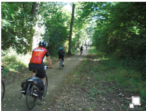
Carriles bici por el interior del frondoso bosque de Chambord

El terreno del castillo consiste en su mayor parte de un denso y espeso bosque, ya que originalmente el castillo se construyó como residencia de caza para el rey Francisco I que fué quien ordenó que fuera levantado (originalmente como "albergue" de caza). Este rey prácticamente no vivió en el castillo, sólo en sus últimos días estuvo alojado en él, pero tampoco lo vió terminado. La aproximación a la construcción se realiza por vías ciclistas segregadas de la carretera, que circulan por el profundo bosque por donde apenas se ve el sol, a causa de los altísimos y frondosos árboles.