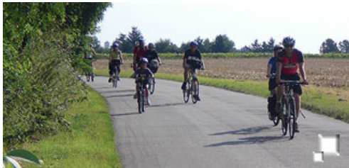
Camino de Blois

Primera de las rutas "en línea" que realizaremos a lo largo de la semana. La rutina, que va a ser la habitual del resto del viaje, es el almuerzo entre las 8 y 8:30 en el hotel, luego preparación de la maleta para el traslado y "enseres" a llevar con uno mismo: barritas, agua, algún mapa, chubasquero o algo de ropa, etc... Las bicis alquiladas llevan una bolsa en el manillar que permite portar a mano algunos de estos enseres, y que es muy útil para tener cerca la cámara de fotos y hacer un montón de instantáneas incluso en marcha.