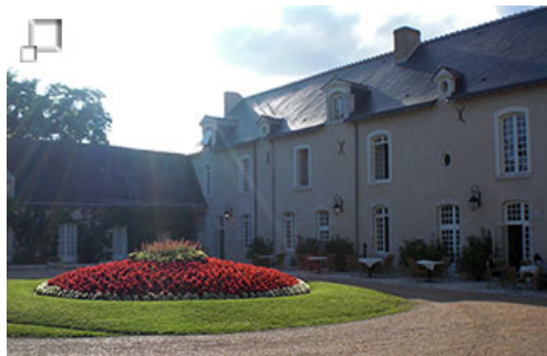
Manoir Bel Air

El punto de partida del viaje está en el hotel Manoir Bel Air , situado en el pueblo de Saint Dyé sur Loira . El hotel es una antigua mansión, situada en la orilla sur del río Loira , justo a la salida de la localidad. El lugar es precioso y nada más llegar parece que te encuentres en otra época. Cada grupo de integrantes llega por diversos modos a este punto, bien en avión hasta París y luego en tren a Blois, donde la organización te recoge, o bien en tren desde Barcelona o Madrid también a Blois. Otra posibilidad (la escogida por nosotros), ha sido llegar en coche por nuestra cuenta, haciendo el trayecto en dos etapas con noche de camino.