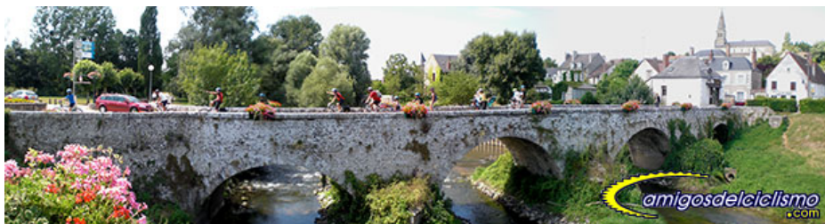
Candé y el puente viejo

intentando soportar el intenso y húmedo calor de la mejor forma posible.