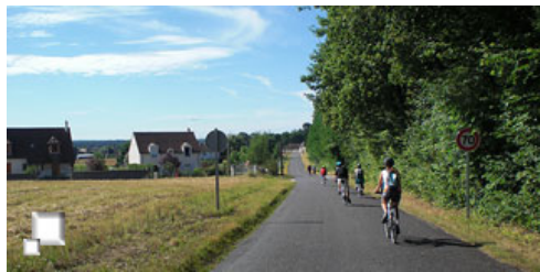
Circularemos por carreteras con poco tráfico

Se parte del precioso hotel de St Dyé du Loira para dirigirnos a los dominios del castillo de Chambord , uno de los más espectaculares de Francia. Se circula por carreteras con poco tráfico y carriles bici, asfaltados o de tierra compactada, con lo que se puede realizar perfectamente el recorrido con una bici de paseo o una híbrida. De St Dyé pasamos por el pequeño pueblo de Maslives para llegar la Chaussée le Comte . En este punto superamos una de las puertas que delimitan el terreno perteneciente al castillo de Chambord, todo él rodeado por un alto muro de piedra y al que sólo podemos acceder por alguna de las puertas.