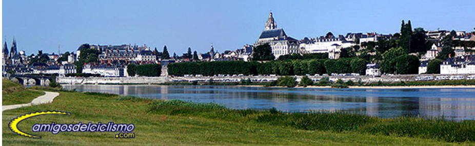
Vista de Blois desde la otra orilla del Loira

Primera de las rutas "en línea" que realizaremos a lo largo de la semana. La rutina, que va a ser la habitual del resto del viaje, es el almuerzo entre las 8 y 8:30 en el hotel, luego preparación de la maleta para el traslado y "enseres" a llevar con uno mismo: barritas, agua, algún mapa, chubasquero o algo de ropa, etc... Las bicis alquiladas llevan una bolsa en el manillar que permite portar a mano algunos de estos enseres, y que es muy útil para tener cerca la cámara de fotos y hacer un montón de instantáneas incluso en marcha.