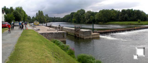
Esclusas en el río Cher

Mientras tanto, el resto del grupo seguía subiendo siguiendo el cauce del Cher, por unos preciosos paisajes de río, pueblos, casonas y esclusas; bucólico y muy diferente del Loira. Pasamos sin detenernos por el pueblo de Montrichard , con un castillo bastante ruinoso, pero más parecido a los que encontramos por España y el pequeño pueblo amontonado a su alrededor. Seguimos cauce arriba hasta llegar al pueblo de Bourre , conocido turísticamente por dos cosas: unas casas excavadas en la roca al estilo de las casas trogloditas de Guadix (Granada), y unas explotaciones de setas en túneles subterráneos. Esperamos la reagrupación en una de estas tiendas - fábricas de setas, en las que es posible una visita guiada a su interior, y reemprendemos el camino, ahora con una moderada subida para salir del cauce del río Cher.