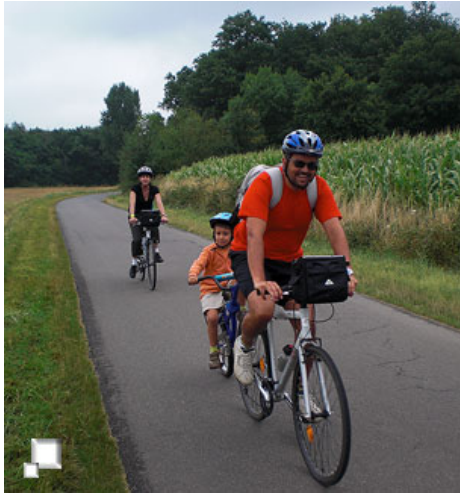
De nuevo en marcha, con bici-tandem

A priori, sobre el mapa, hoy parece presentarse una ruta bastante más larga que las hechas hasta ahora, y así resulta al final. Un total de 50 km y unos 360 m de desnivel acumulado la sitúan como la " etapa reina " del viaje, aunque todos los ciclistas del grupo, incluidos los más pequeños y mayores, la acaban en su totalidad sin problemas.