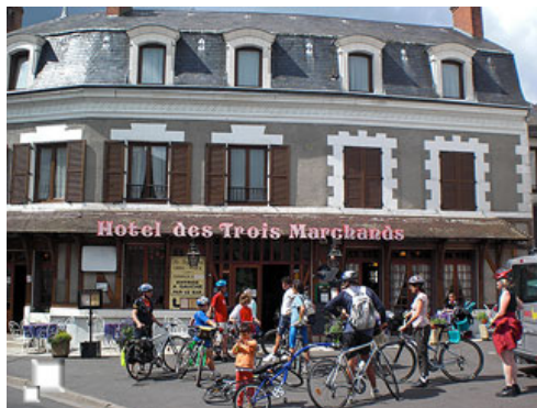
Grupo al llegar al hotel de Cour-Cheverny

Esta mansión con poca pinta de castillo, tiene algunas peculiaridades, aparte de ser la inspiración para el dibujante de Tintín de la casa donde vive este personaje. Una de ellas es que todavía está habitada. Es una mansión privada y sólo es visitable parte de ella, porque tal como se ha comentado, la familia del descendiente del antiguo dueño y constructor de la mansión, todavía vive en ella. La otra de las peculiaridades que tiene son algunos de los fastuosos árboles que tiene el jardín que la rodea, como una impresionante sequoia o un inmenso platanero, cuyas ramas son tan grandes y largas que se apoyan en el suelo.